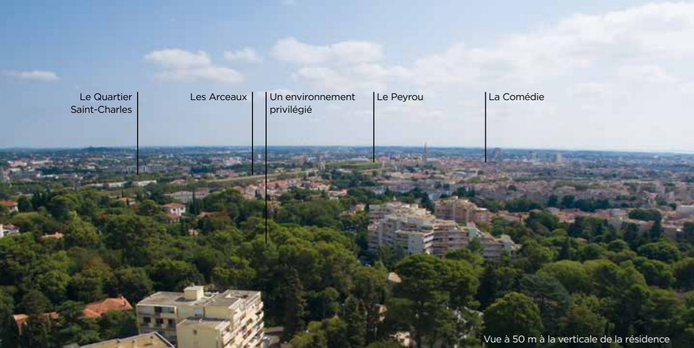
Vue à 50 m à la verticale de la résidence